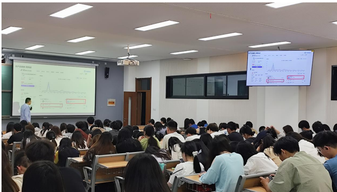
图 1 江苏龙道数据集团有限公司给电商 22 级、23 级学生进行培训