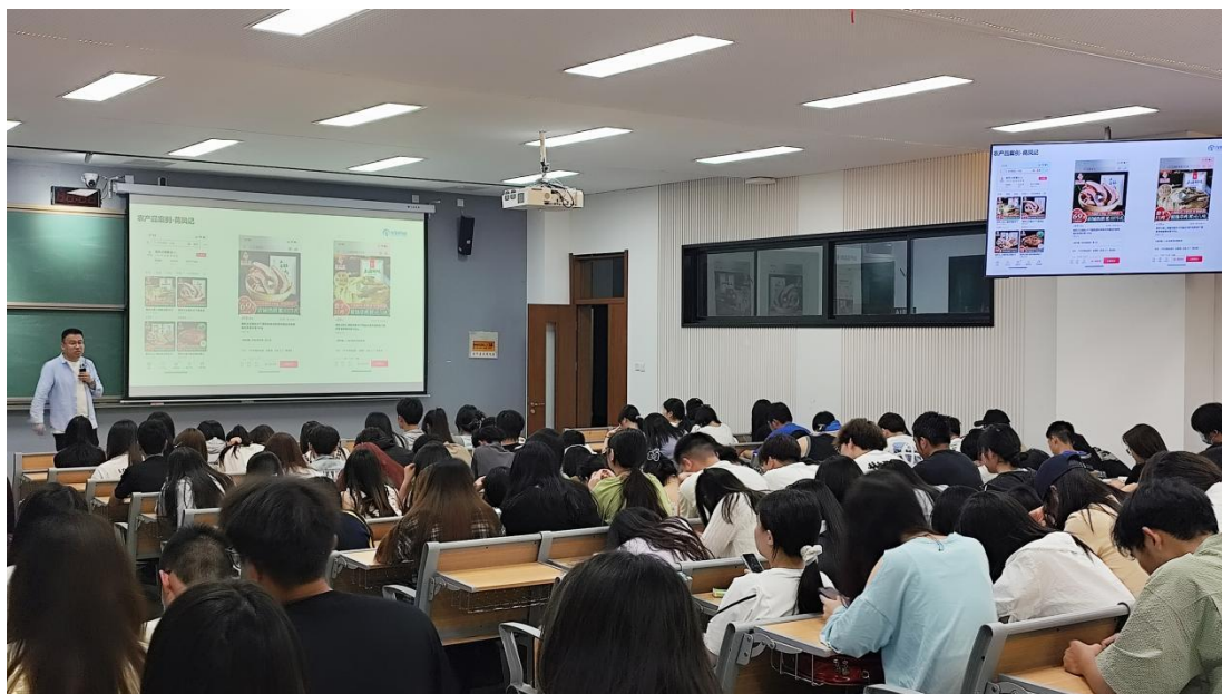
图3 江苏龙道数据集团有限公司订单班宣讲会